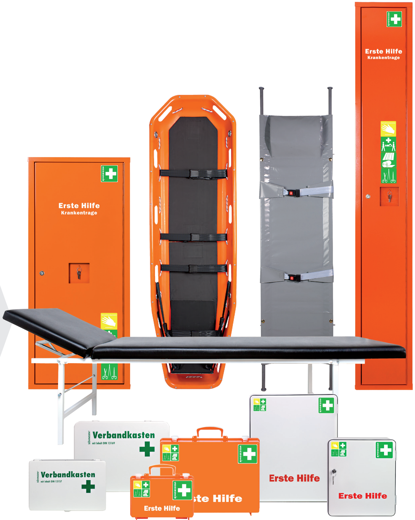
Anbausafe • Schleifkorbtrage • Krankentrage • Stehschrank • Untersuchungs-liege • Verbandkasten • Erste-Hilfe-Koffer • Verbandschrank