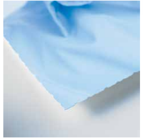
Büthen-Schnittkante zur Papierveredelung